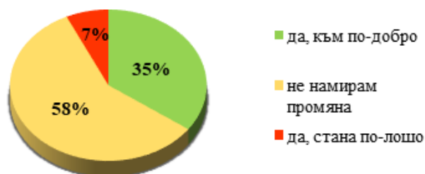
Фиг. 4. Отношението на пациентите към ПЗГ в условия на пандемия

Значим мотивиращ фактор за ПЗГ са взаимоотношенията с пациента/клиента. С. Борисова (2020) определя niskия обществен и социален престиж на професионалистите по здравни грижи като една от слабостите в практиката [3]. Въпреки променената обстановка повече от половината респонденти (58 %) са на мнение, че отношението на пациентите към тях не се е променило. Обнадеждаващо е, че според 35% от анкетиранияте пациенти са станали по-добри към тях и едва шест от участниците в проучването считат, че отношението е променено, но към по-лошо (фиг. 4).