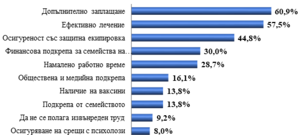
Фиг. 5. Мотивиращи фактори за ПЗГ за работа при бъдеща пандемия

2. Факторът с най-силно отрицателно въздействие върху психиката на ПЗГ е при-