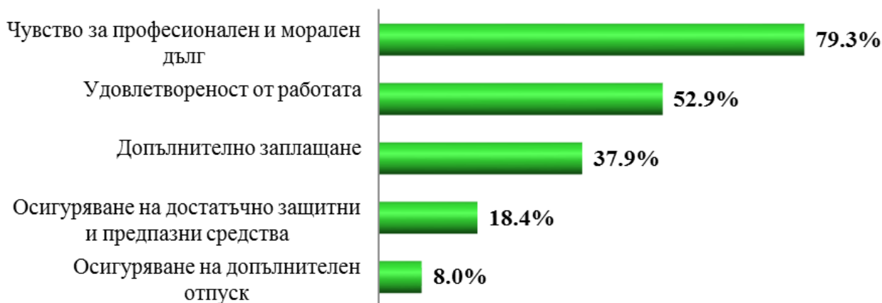
Фиг. 3. Мотивиращи фактори за ПЗГ да продължават да работят